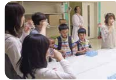
毎年大人気の『水の飲み比べ』