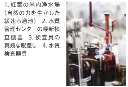
1. 紅葉の米内浄水場（自然の力を生かした緩速ろ過池） 2. 水質管理センターの最新検査機器 3. 検査員の真剣な眼差し 4. 水質検査器具