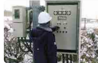
公共下水道マンホールポンプの点検状況