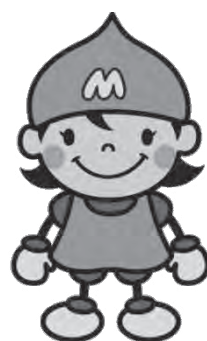
下水道あいちゃん