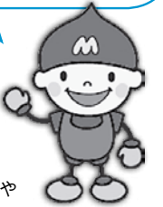
上下水道局マスコット キャラクター水道ぼうや

水抜栓の半開きや中途半端な操作は、凍結や漏水の原因。水を抜くときも使うときも、水抜栓の開閉をしっかりすることが大切です