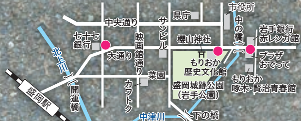
下水道デザインマンホール カラー蓋設置MAP